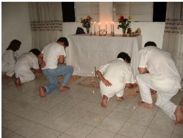
Saudação e firmeza dos Caboclos

Tivemos, neste dia, a oportunidade de contar com a presença de Médiuns que, apesar de não fazerem mais parte de nossa corrente, ainda seguem os fundamentos da Umbanda, de perdão amor e caridade e por isso devem ser sempre protegidos pela Corrente Astral de Umbanda, pois temos consciência que para executar as obras do Pai não precisamos necessariamente fazer parte de uma casa religiosa.